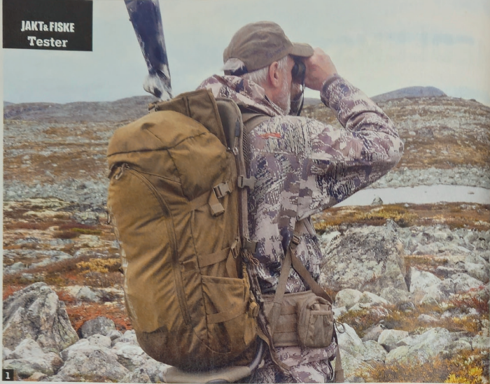
1 Dagstursekk: Sekkeramma med en påmontert 40 liters dagstursekk og en våpenholder mot ryggen.