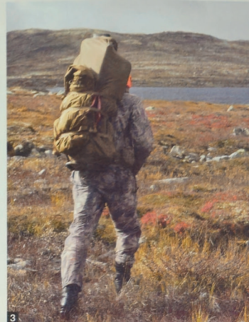
3 Pakksekk: Med pakksekken montert på ramma, kan du fint bære en hel simle. Her er 40-literen festet under stroppene.