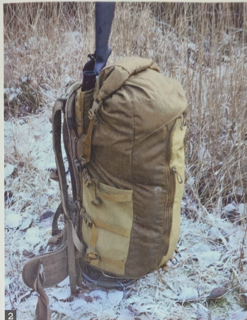
2 Langtursekk: Denne sekken rommer 80 liter og har plass nok til en overnattingstur på fjellet. Våpenholderen holder styr på børsa.

Med maks last lutet toppen av sekken litt bakover, fordi feste-glidelåsene ikke når toppen av ramma. Våpenholderen hadde derimot nok plass også bak en stappfull sekk. Bæresystemet gjør sekken god å bære med tung last og lett å regulere for optimal komfort underveis. Merk: Tanken er at du bærer med deg den tomme pakksekken i tillegg, slik at du bygger om sekken for utbæring av kjøtt. Derfor lander dette oppsettet (inkludert tom pakksekk) på 4090 g.